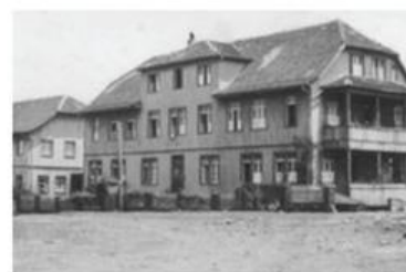
Colégio de madeira - Primeiras instalações do CSIC