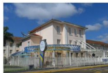
Instalações atuais do CSIC