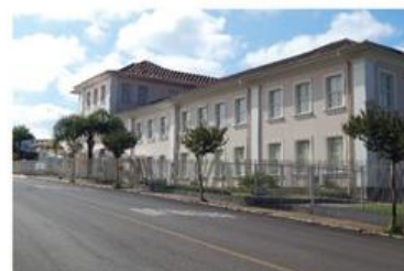
Instalações atuais do CSIC